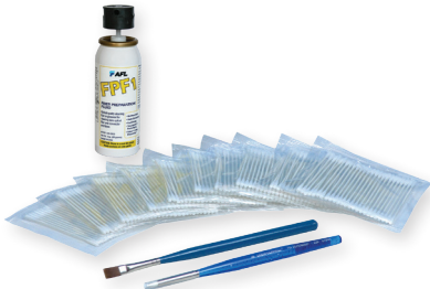
Splicer V-groove Cleaning Refill Kit